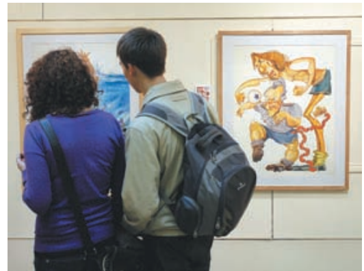
Acto - La apertura de la muestra fue ayer y se extenderá hasta el 10 de julio.

La obra de Andrés Cascioli, uno de los dibujantes y caricaturistas más importante de la Argentina, fallecido en junio de 2009, y creador de revistas como Satiricón , Chaupinela , Humor , Humi , sexHumor , Fierro y El Periodista , invadió ayer el Museo del Humor (avenida de los Italianos 851, Costanera Sur) en el marco de la muestra "Cuarenta años de